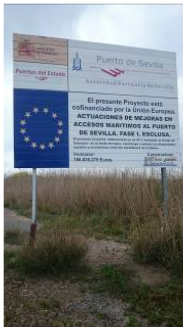
Cartel de las obras de la esclusa en la Puerto de Sevilla

Desde un principio se han querido vincular los fondos europeos al “dragado del Guadalquivir”, de forma que o se ejecutaba el mismo o había que “devolver el dinero”, como afirmó, por ejemplo, la Plataforma “Sevilla por su puerto” en enero de 2015 .