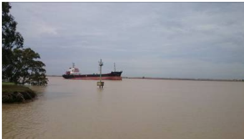
Barco navegando a la altura de Lebrija

Ahora, la Dirección General de Medio Ambiente de la Comisión Europea da la razón a WWF España en su queja: el dragado del Guadalquivir puede vulnerar la directiva comunitaria 92/43/CEE relativa a la conservación de los hábitats naturales y de la fauna y flora silvestres. Las autoridades españolas tienen dos meses para tomar medidas, y en ausencia de una respuesta satisfactoria, la Comisión podría llevar a España ante el Tribunal de Justicia de Luxemburgo.