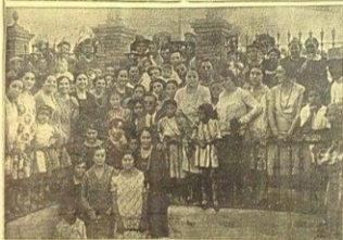
Inauguración de una fuente pública en Tomares

Según consta en el diario la UNIÓN en fecha 18 de agosto de 1927, se inauguran las obras de remodelación de una fuente pública (fuente de la Plaza) en el centro de la localidad de Tomares. Como se refleja en las fotos del periódico debido a encontrarse a una cota inferior a la calle se accede a través de una escalinata y rodeada por una barandilla metálica en la zona interior y un cerramiento de fábrica de ladrillo visto en su parte baja y enrejado en la parte superior.