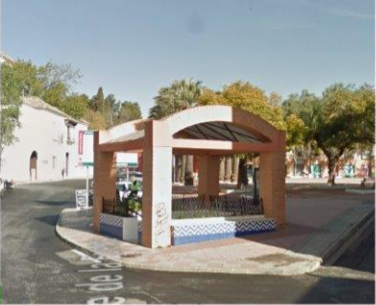
Fuente de la Plaza