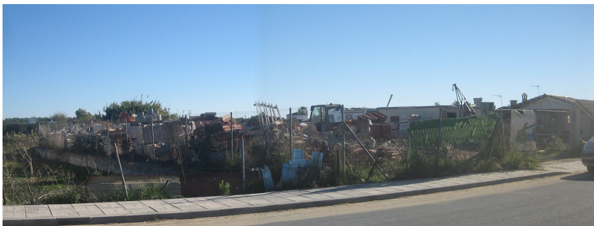
Vista panorámica de la parcela.

Como puede observarse en el Estudio de Inundabilidad de ese Proyecto (Anexo 4), base de los actuales trabajos de restauración del Riopudio, el terreno donde se sitúa la parcela constituye una zona inundable con avenidas de menos de 50 años e incluso 10 años de periodo de retorno.