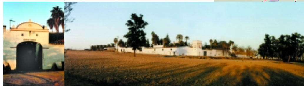
Hacienda de Torrijos

Se encuentra situada en el punto donde se encuentran los términos municipales de Bormujos, Gines y Espartinas, siendo muy visible desde los principales accesos a la comarca. Tiene una curiosa torre-palomar cuadrada con cubierta estilizada de tejas a cuatro aguas.