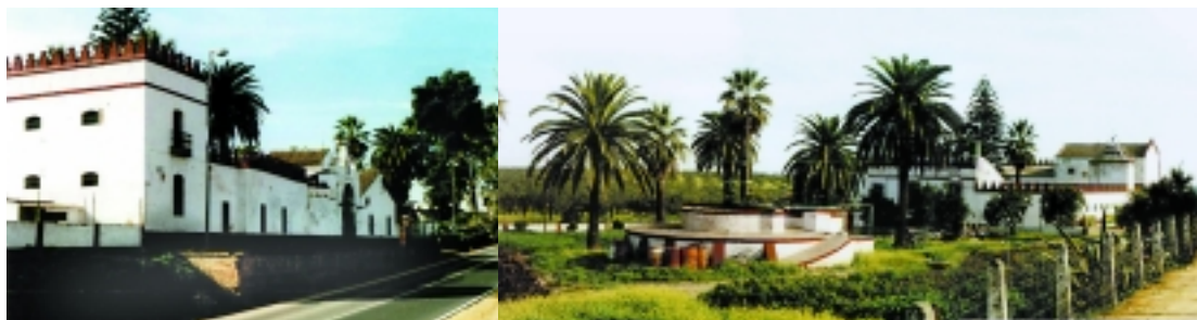
Hacienda de los Remedios