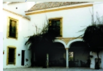
Hacienda de Marchalomar