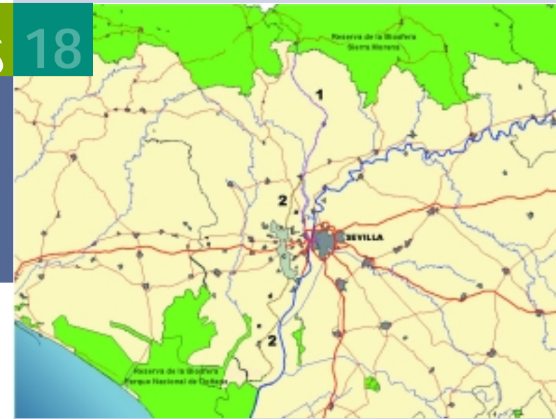
CORREDOR VERDE DEL RIOPUDIO EN CAMINO ENTRE LA VÍA DE LA PLATA Y DOÑANA

Desde ADTA, pedimos a los Ayuntamientos, Administraciones públicas, entidades y ciudadanos en general del Aljarafe y del Área Metropolitana, apoyo para la consecución del Corredor Verde del Riopudio, por el bien de los habitantes actuales y futuros, del medio ambiente y del mantenimiento de la identidad histórica y cultural de nuestra comarca.