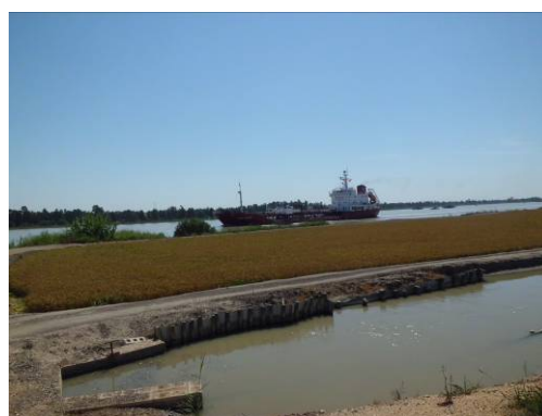
Barco remontando el río hacia Sevilla

Las administraciones públicas implicadas en la gestión del río -estatales, autonómicas y locales- están obligadas en este contexto a garantizar la preservación, mantenimiento y gestión integral del Guadalquivir. Para ello deben establecer los mecanismos de coordinación necesarios para adoptar las medidas de gestión coordinadas que aseguren la conservación de la biodiversidad y aumenten el valor de sus recursos pesqueros –directamente ligados a los de todo el litoral atlántico andaluz, al tiempo que se da solución a los problemas de erosión de la costa oriental onubense por el cambio de dinámica del Estuario del Guadalquivir.