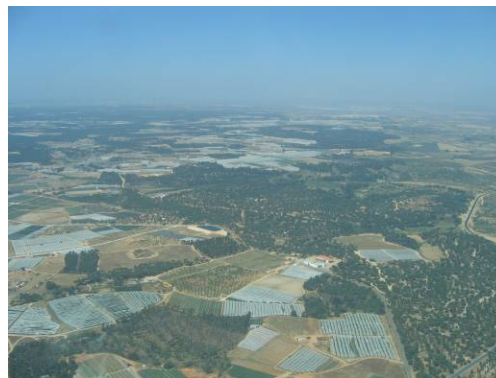
Vista aérea de la zona fresera de Doñana

WWF recuerda que Doñana necesita urgentemente reordenar el territorio y, posteriormente, regularizar las fincas posibles respetando la conexión entre zonas naturales, todo ello englobado en un Plan para ordenar los recursos naturales y buscar soluciones a los conflictos. El Plan Especial de la Corona Forestal Norte de Doñana podría ser la herramienta para conseguir esta ordenación territorial siempre y cuando se