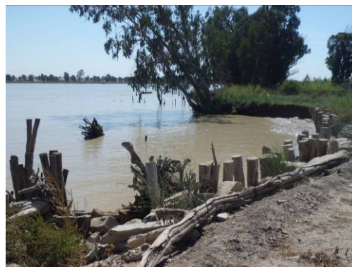
Erosión de las riberas del Guadalquivir a la altura de Veta de la Palma