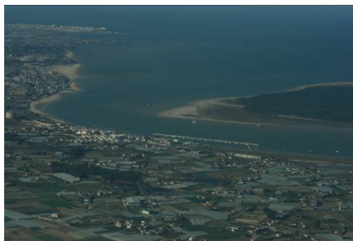
Vista de la desembocadura del Guadalquivir

Las jornadas se celebrarán en el Salón de Actos del Pabellón de México (Avenida de la Palmera s/n) a partir de las 10 de la mañana (la recepción será entre las 9 y las 10 de la mañana).