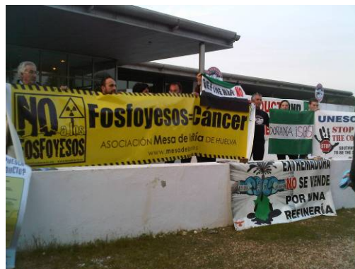
Protestas de colectivos ciudadanos y ecologistas durante la visita de la Misión Unesco-Ramsar-UICN en 2011

Asimismo, el Club solicita que Doñana se inscriba en la Lista de Sitios en Peligro del Convenio de Patrimonio Mundial, revisándose en un año su situación, de forma que si se siguen incumpliendo las recomendaciones, este espacio natural sea eliminada de la lista de Sitios declarados Patrimonio de la Humanidad.