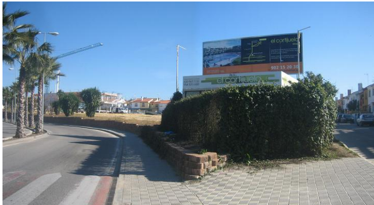
Sistema General de Espacio Libre La Mogaba, propuesto para uso comercial y deportivo.