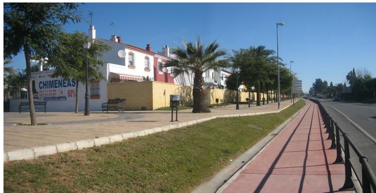
La trasera de las viviendas, parte de las zonas verdes ocupadas para uso privativo.

4.- Áreas libres de “La Mogaba. “Cuando se aprobó el Plan Parcial de “La Mogaba” en 1985, se estableció una serie de viviendas cuya fachada presentaba directamente a espacios libres y zonas verdes del sector, lo que al parecer ha provocado una extensa problemática porque los vecinos entendían invadida su intimidad, habiendo ocupado y acotado en algunos casos parte de dichos espacios.... Desde el Ayuntamiento de Gines se propone el establecimiento de unas franjas de terreno anejas a las viviendas para uso privativo, como espacio libre de parcela, donde no se permita la construcción, para separarlas de las áreas libres y zonas verdes públicas. Las franjas ubicadas en los sistemas locales de áreas libres serán de cinco metros de anchura, mientras que las de los sistemas generales serán de tres metros de media.”. Se trata de un diferente uso para las zonas verdes, por lo que necesitaría informe del Consejo Consultivo de Andalucía. No se justifica la reducción de los espacios libres en esa zona, ya que se acumula esta propuesta con la anterior. Se trata además de una actuación que ya se ha llevado a cabo como se expone en la foto.