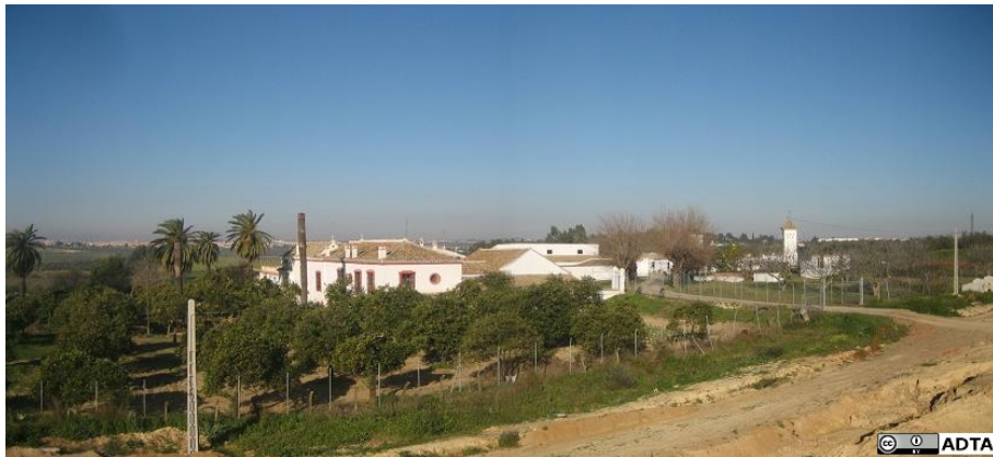
Otra vista más próxima a la Hacienda.