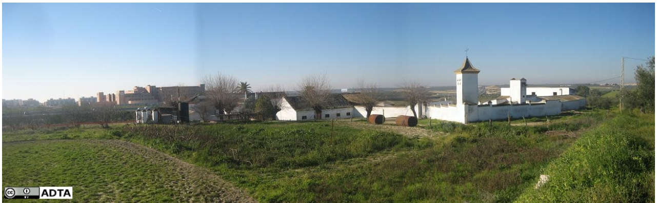
Vista posterior, desde el término de Gines, que llega hasta la misma fachada posterior de los edificios de la hacienda. Al fondo el Hospital de Bormujos. Abajo a la izquierda antiguas instalaciones, y a la derecha el palomar, ambos en la misma línea de término.