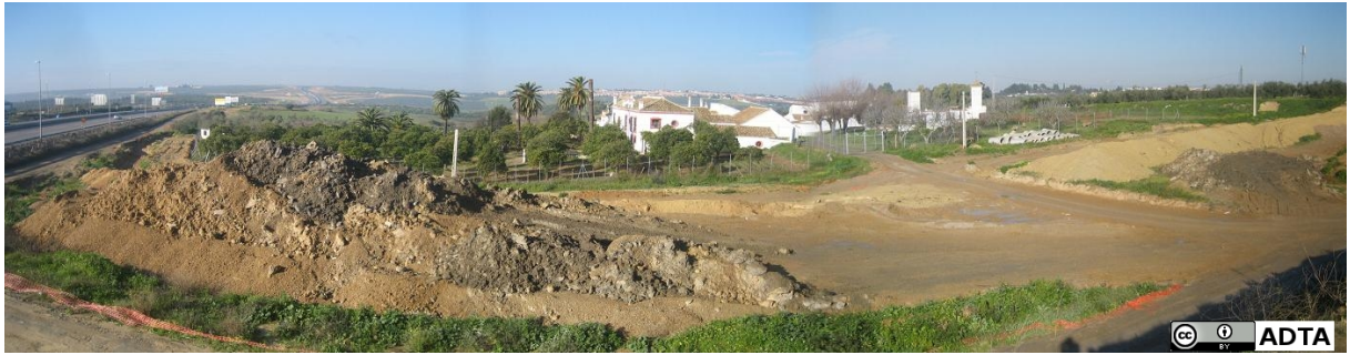
Panorámica de la Hacienda Marchalomar, desde la carretera Bormujos-Gines. En primer plano, obras del nuevo acceso a la A-49.