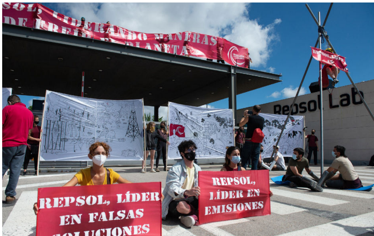
Activistas protestan contra Repsol