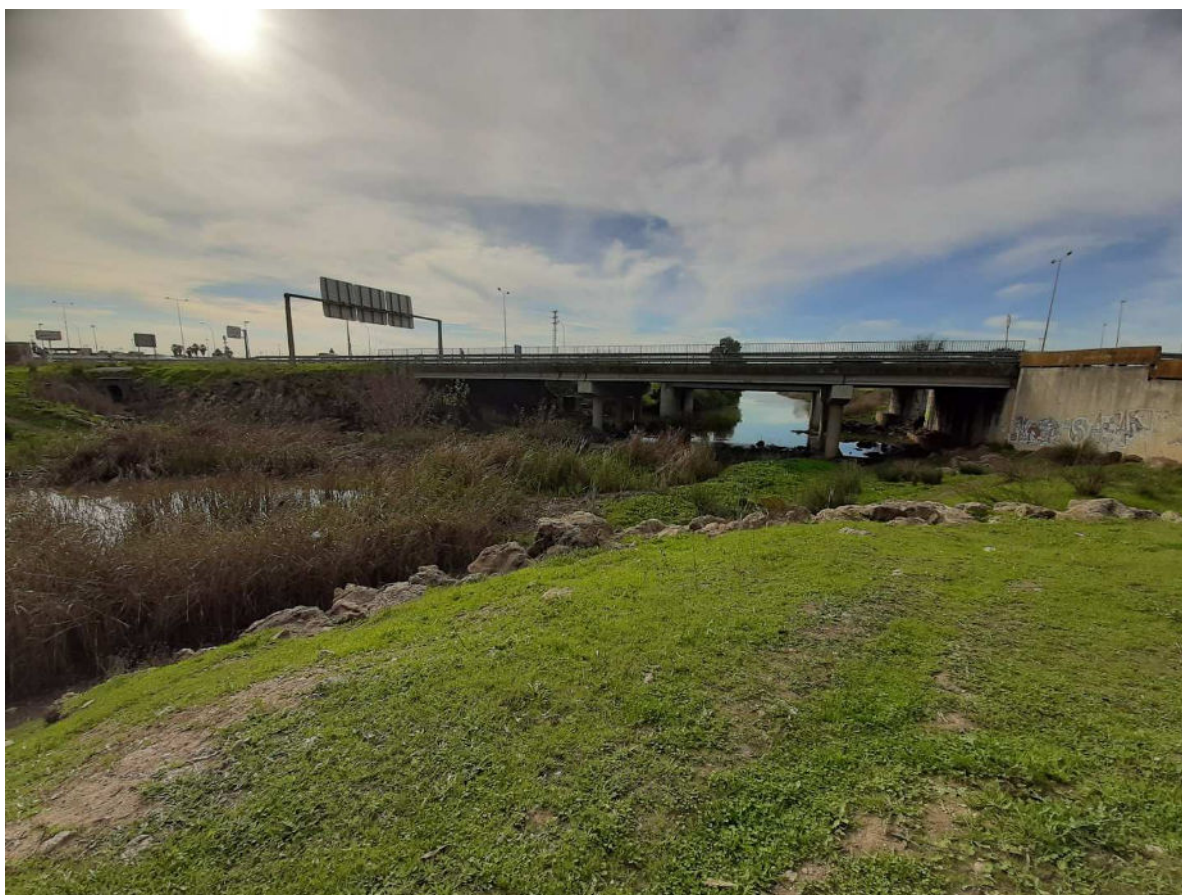
Cruce del Arroyo por la Carretera de Utrera