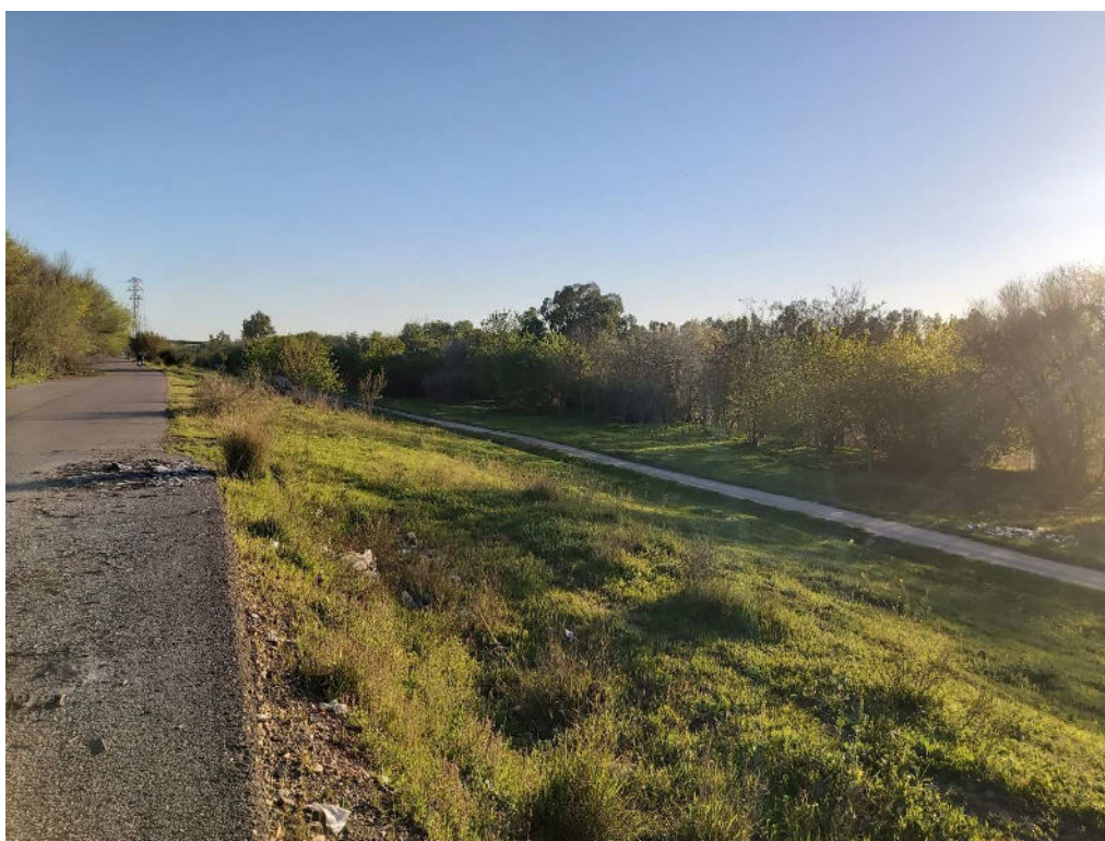
Conexión con el Inicio de la Fase I, en las proximidades al Estadio de Cartuja