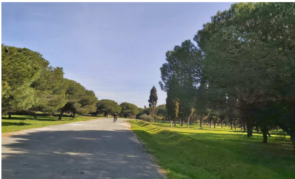
Pinares de Santa Bárbara, ya previstos como Zonas Verdes a desarrollar en el Plan General