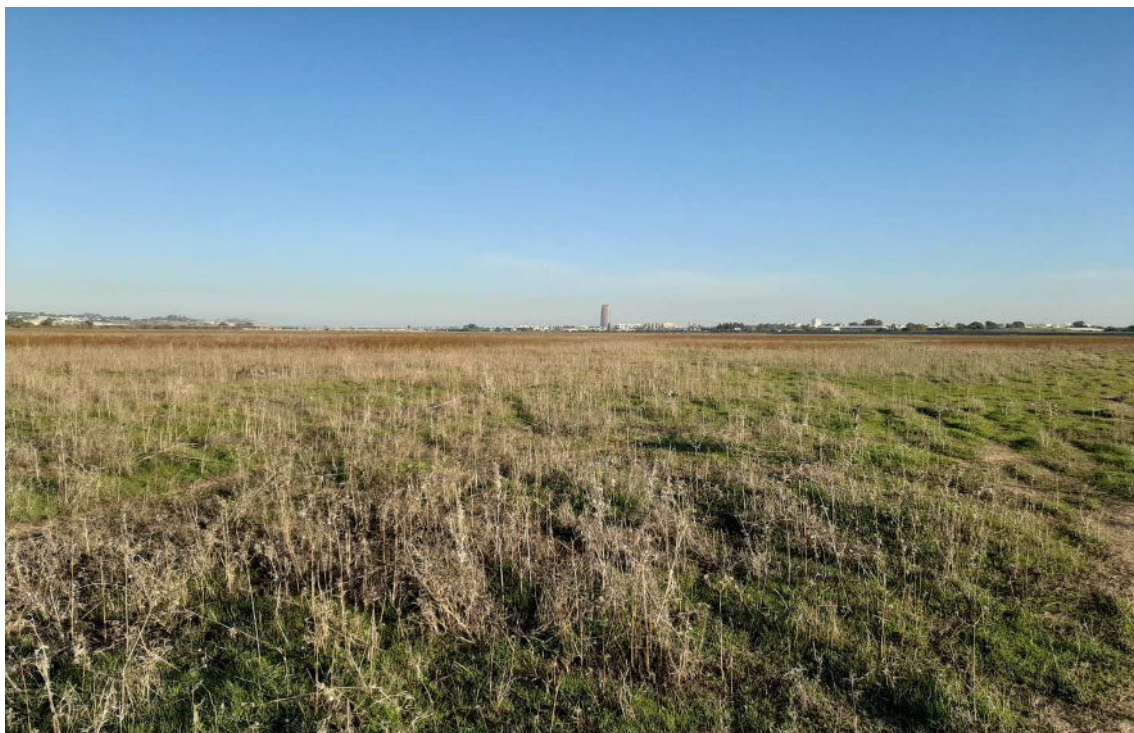
Vista general de la Vega de Tablada que linfa con el trazado propuesto