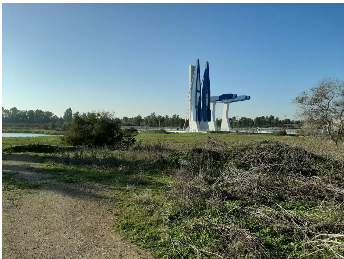
Punto de paso del Anillo Verde en la esclusa del Puerto