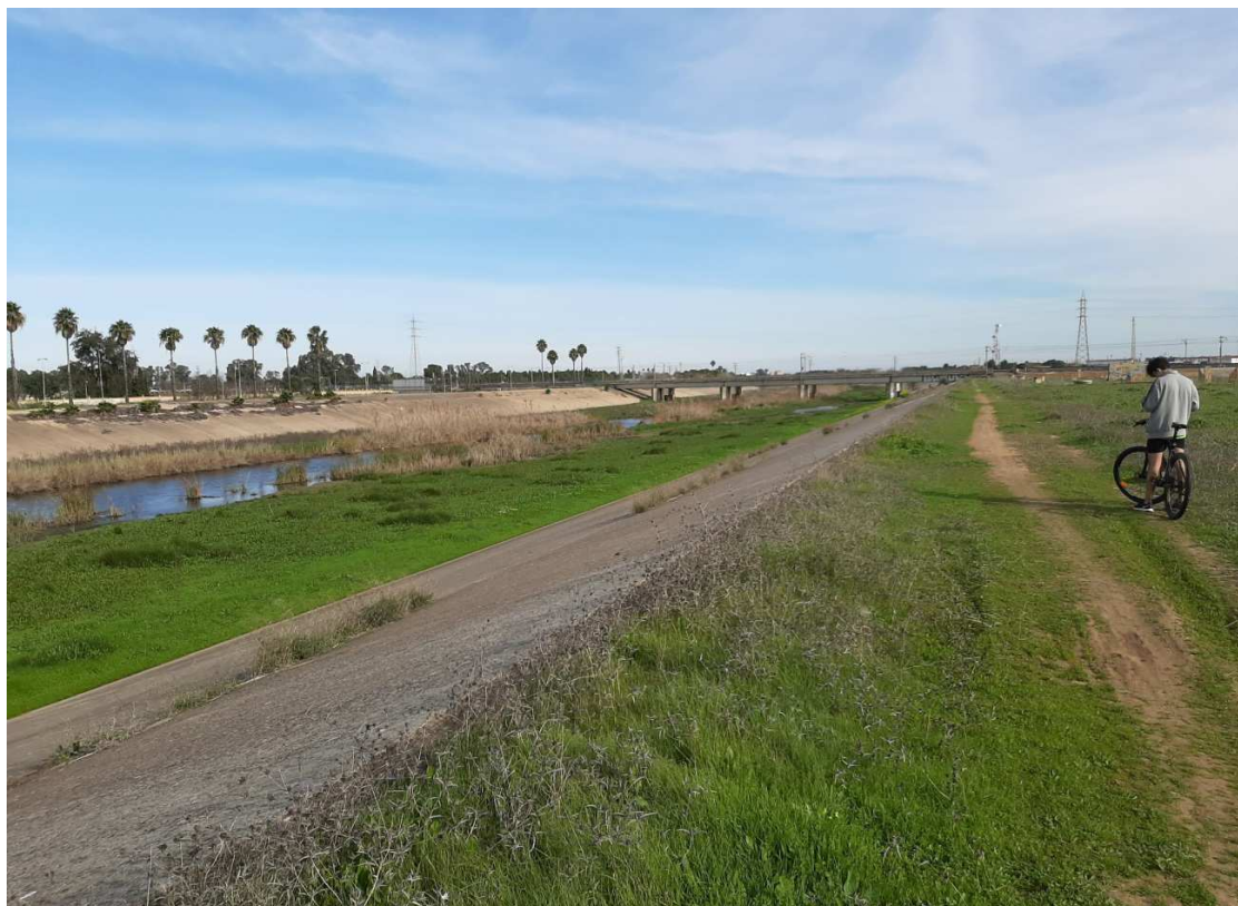
Zonas de protección del Canal del Nuevo Cauce del Río Guadaira