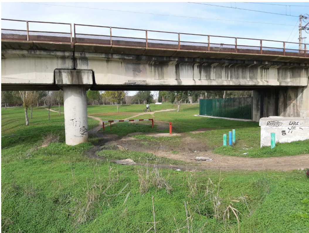
Inicio de la Fase en el paso de la vía Ferrea Junto al Río Guadaira