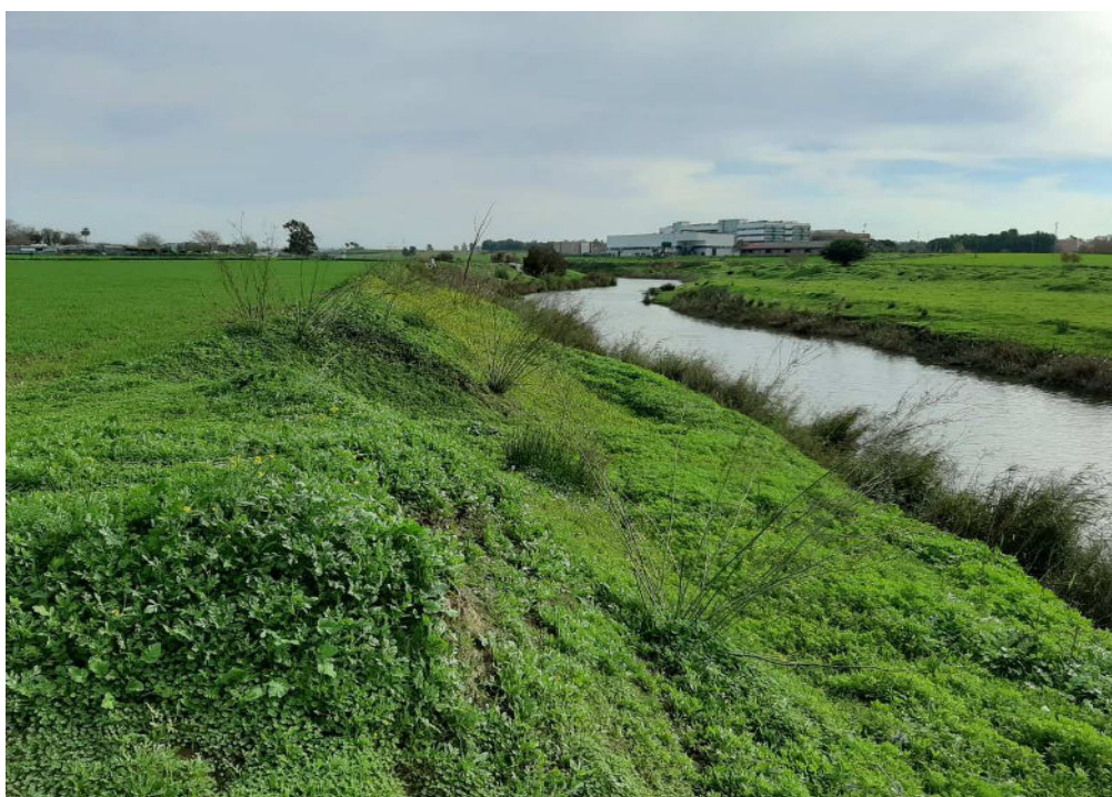
Zonas colindantes con el Río Guadaira que precisan deslinde del dominio público