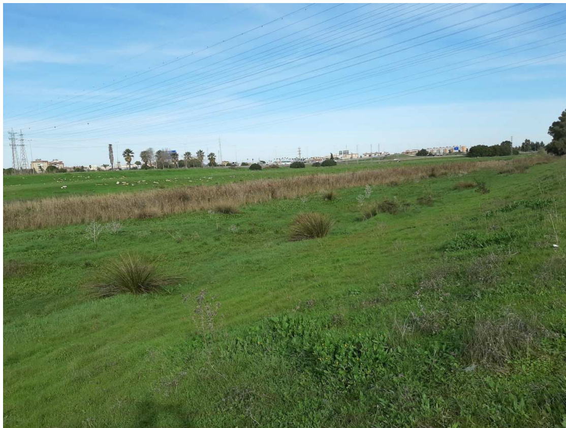
Zonas del Canal sin revestimientos hormigonados y potencialmente integrables