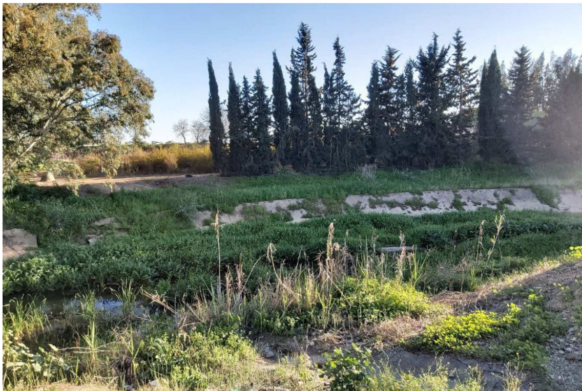
Arroyo de Miraflores en las proximidades de Valdezorras, a su paso por los Viveros de la Diputación