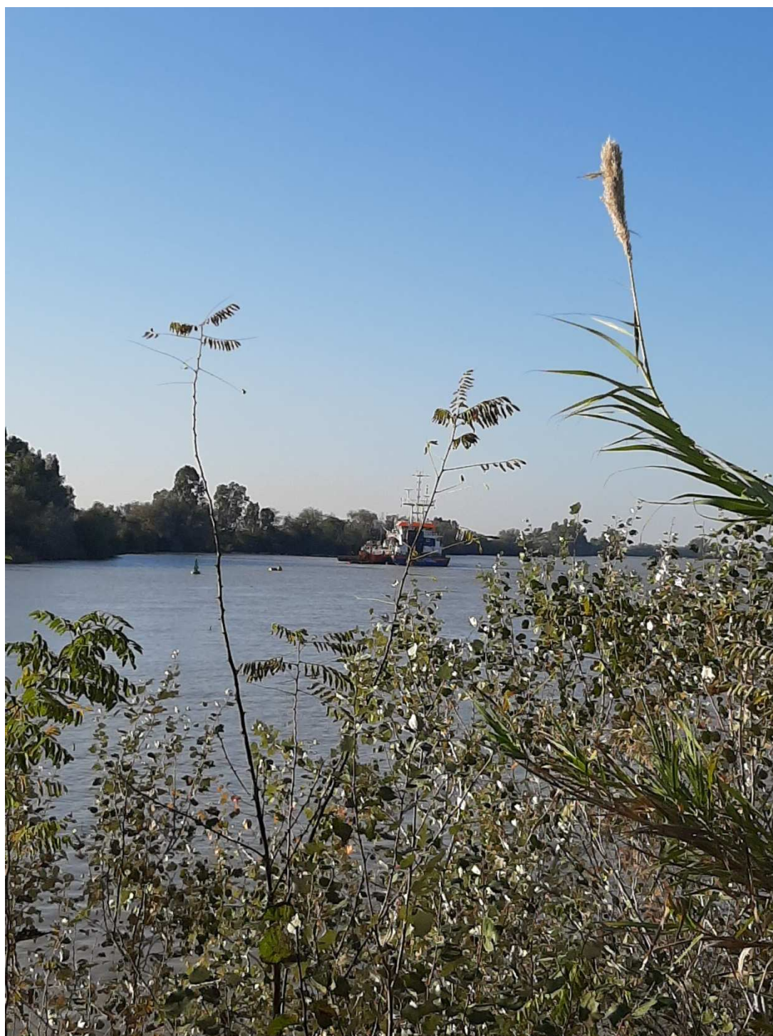
Unión de la dársena con el río Guadalquivir