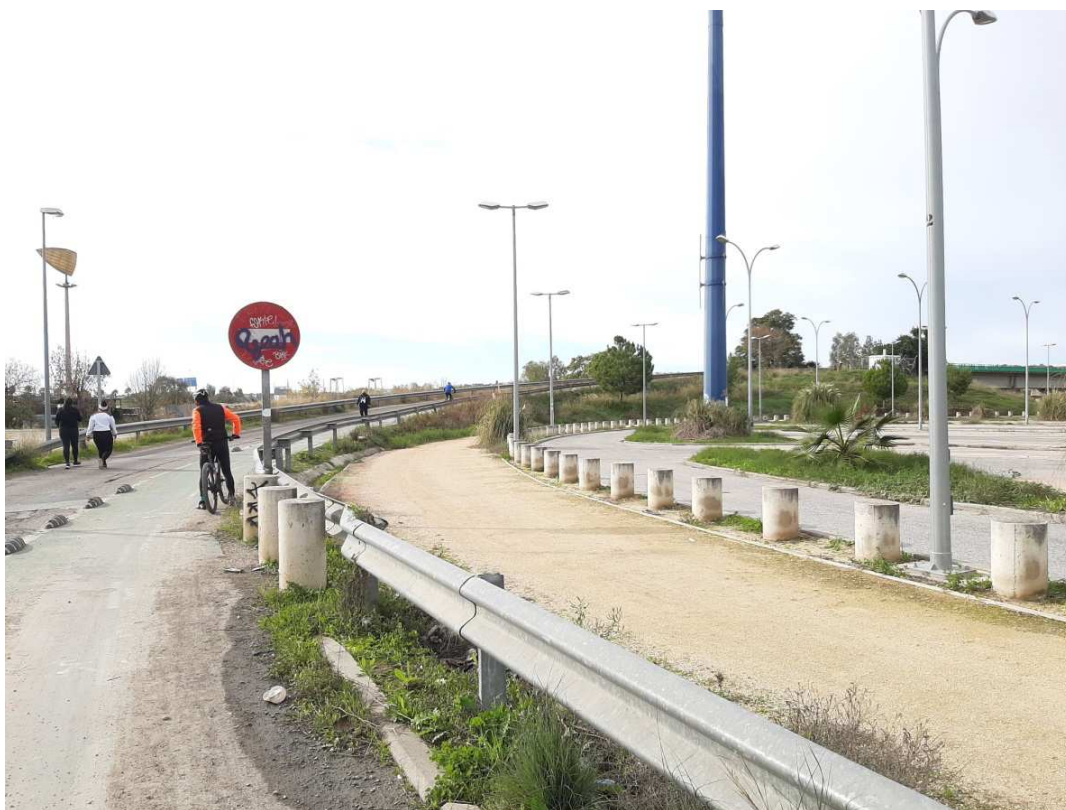
Conexión ya establecida con vías verdes del Aljarafe