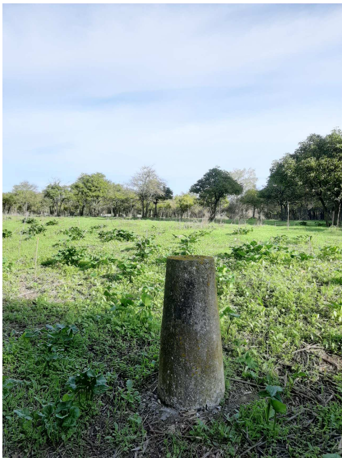
Mojones existentes del deslinde del DPH que definen zona de actuación