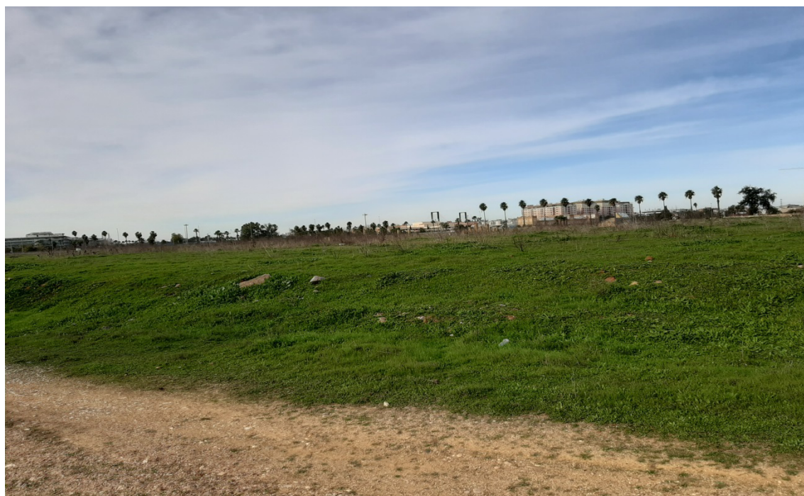
Zonas aisladas y degradadas de potencial incorporación al Anillo