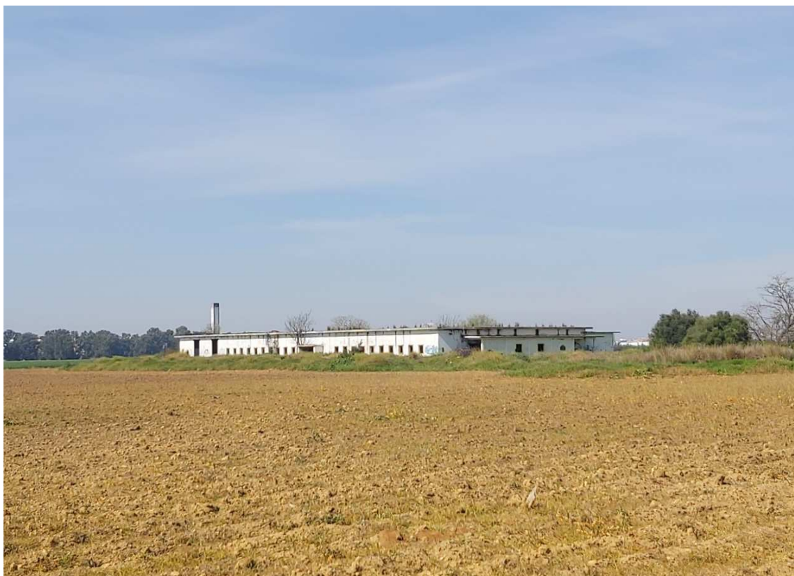
Instalaciones con aparente estado de abandono en el antiguo complejo hospitalario de San Pablo.