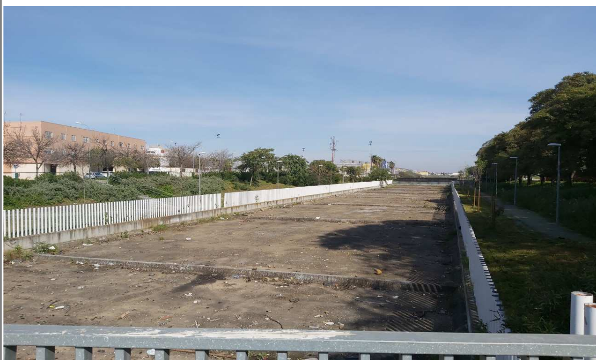
Canal de Ranillas a su paso por San José de Palmete