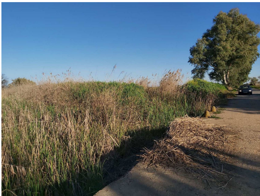
Arroyo de Miraflores en su encuentro con el Camino de los Indios