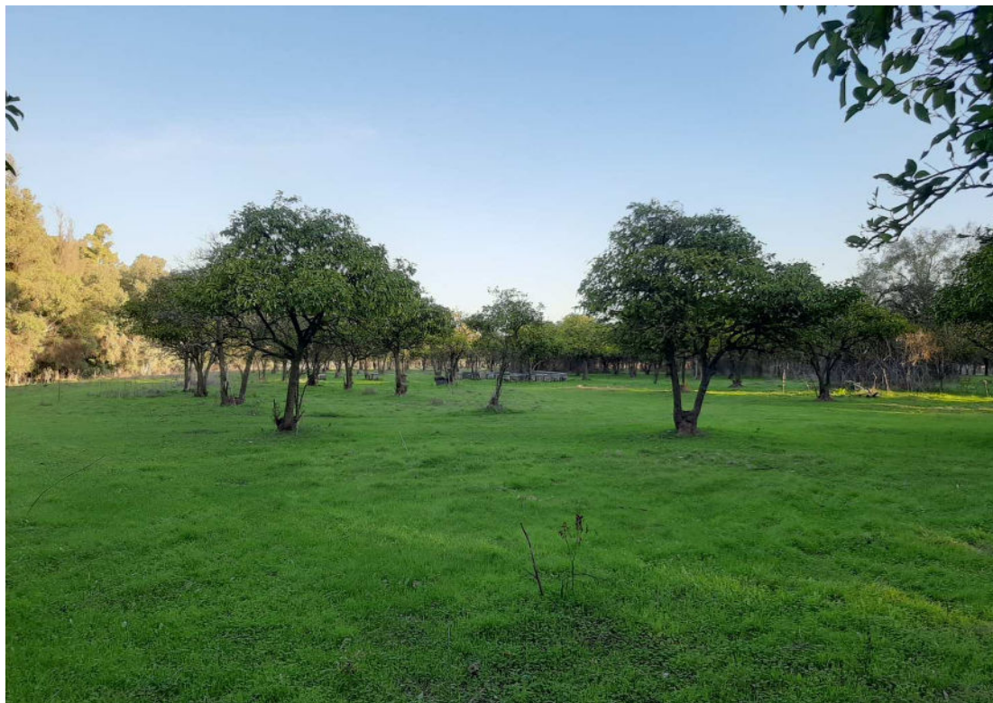
Antiguos huertos de cítricos al paso del anillo en zonas colindantes al DPH