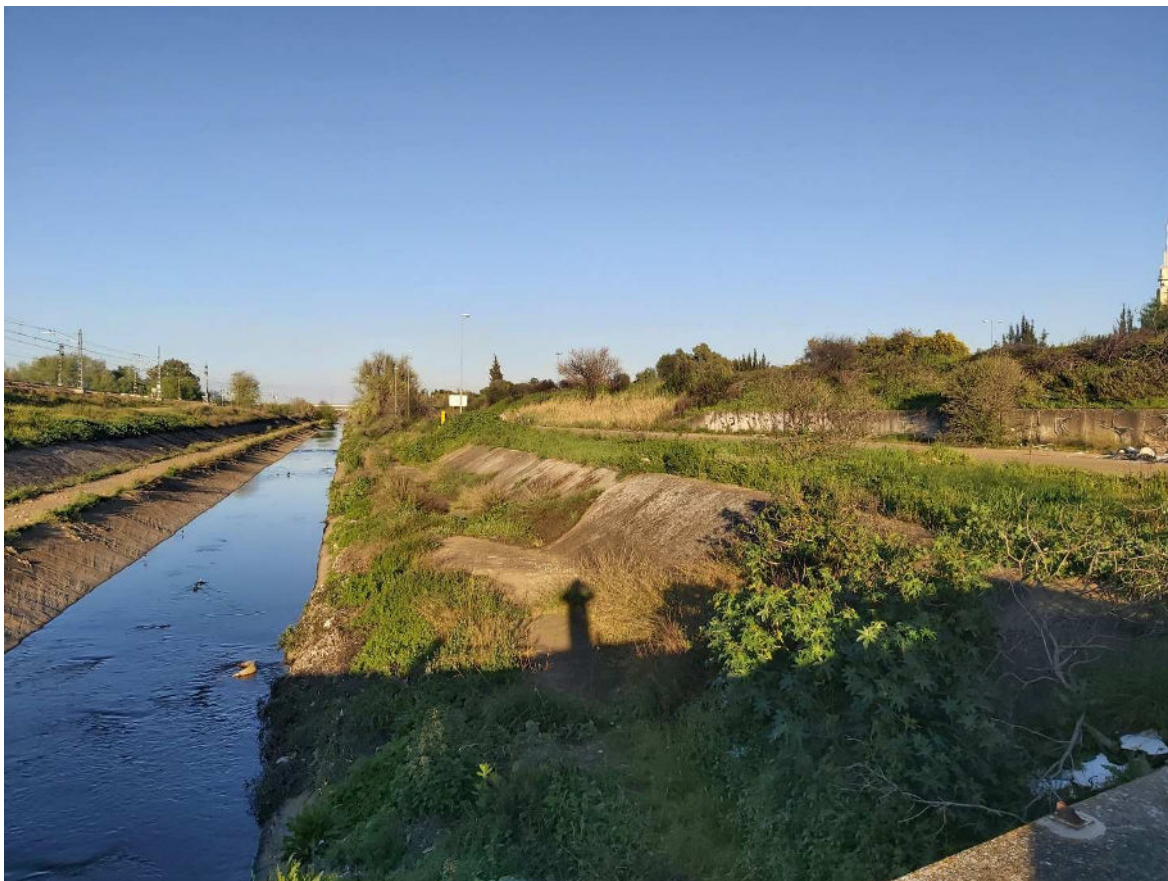
Arroyo del Tamarguillo en proximidades a Isla de Tercia