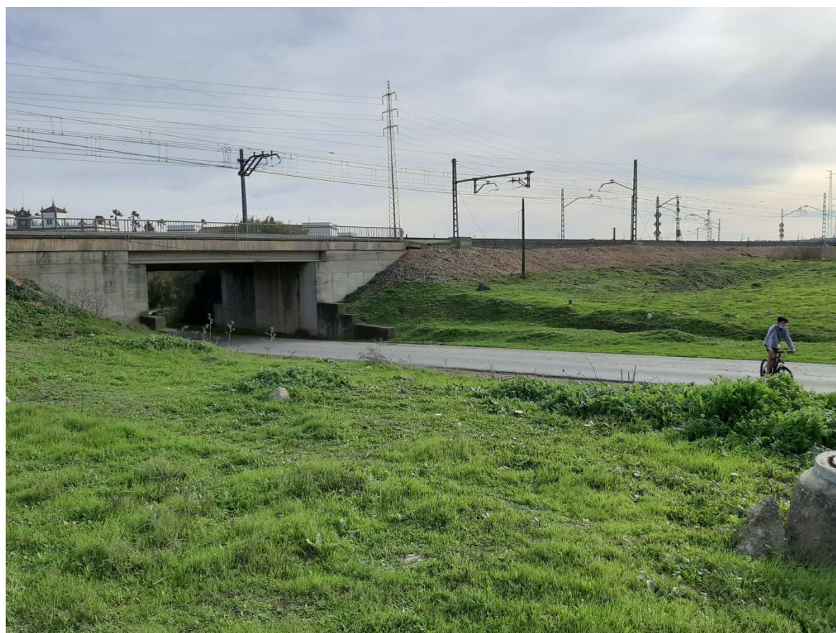
Paso soterrado de la Vía férrea a su entrada en Acuartelamiento de Pineda