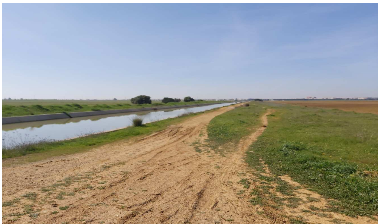
Zonas de servidumbre de paso anejas al Canal del Bajo Guadalquivir, en la circunvalación posible del aeropuerto