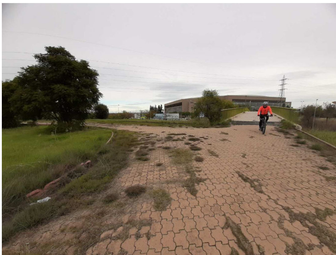
Infraestructuras de conexión con Parque del Alamillo y Parque de San Jerónimo en uso