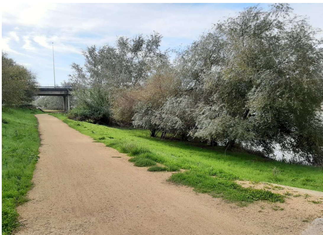
Vía verde ya existente paralela al río en buena parte del trazado