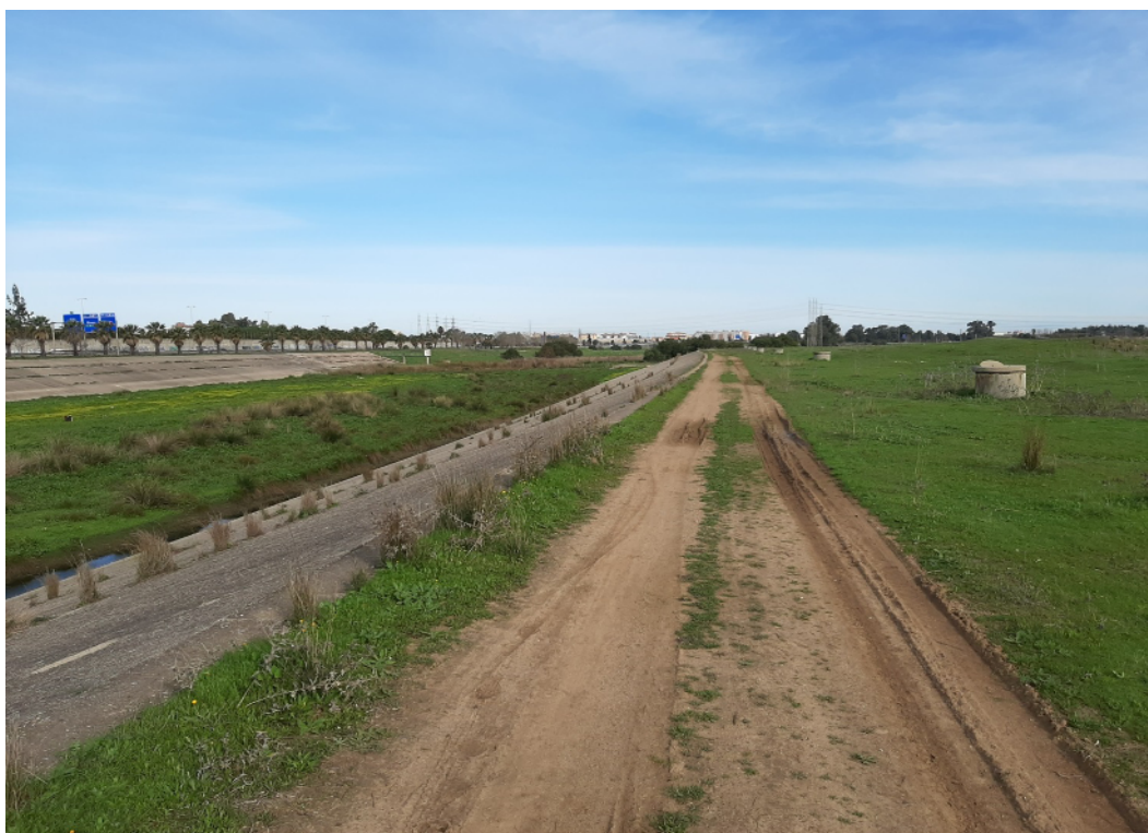
Zonas próximas al Canal susceptibles de integración