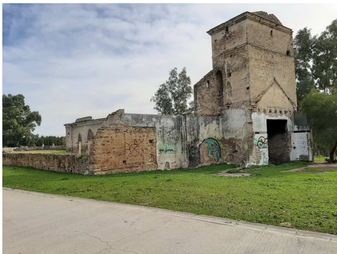
Paso junto al Molino de San Juan de los Teatinos en el Parque Guadaira 1