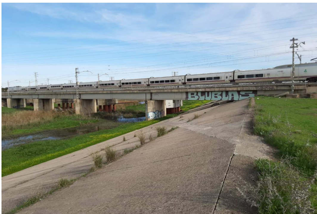
Paso de la Vía del Tren de Sevilla-Cádiz